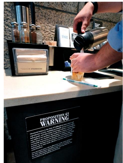
미국 LA의 한 스타벅스 매장에 붙어있는 유해 물질 규제 법령인 '캘리포니아 법령 65' 경고문

Ex) Cancer, birth defects, reproductive harm